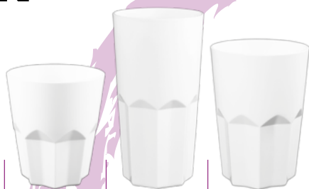
FACETA TUMBLER FACET FACETTE ECO 33 CI FACETA TUMBLER FACET FACETTE ECO 33 CI LONG FACETA TUMBLER FACET FACETTE ECO 40 CI